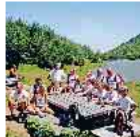
Il gruppo sportivo dei vigili urbani di Piacenza al lago Nero