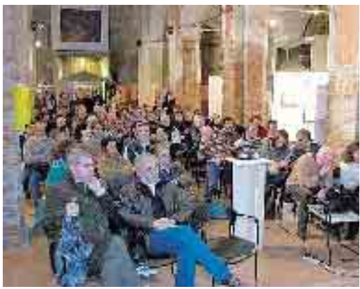
PIACENZA - No tube: in 150 all'incontro nella Galleria Rosso Tiziano per fare il "punto della situazione"

Il reading "Ecco a voi i predatori dei fiumi" infatti ha ribadito i "no" portati avanti dal comitato: stop all'intuba-