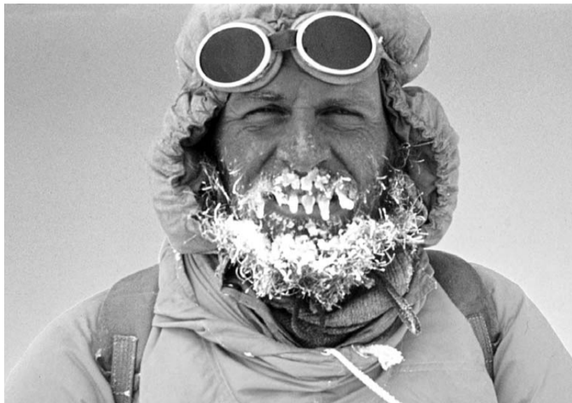
Nella foto, Kurt Diemberger

Kurt Diemberger è nato a Villach (Austria) il 16 marzo 1932 (stesso